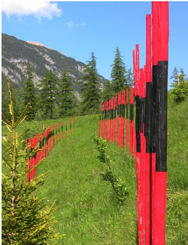
En Passant, 2010